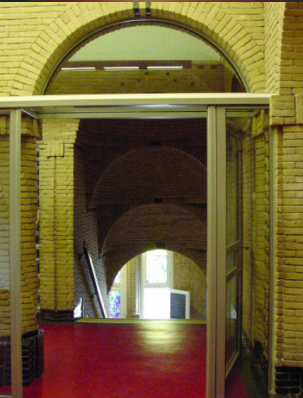
Herstelde allure in de gangen, voorzien van veiligheidsdeur

Het plan zelf wordt door de architect als volgt omschreven: "Door effectief gebruik te maken van de 2 oude gymzalen voor 9 nieuwe lokalen, het onder de grond bouwen van de nieuwe gymnastiekaccommodatie en bibliotheekfuncties, en de ondergrondse bebouwing te voorzien van een groen 'bewoners'dak, wordt het karakteristieke schoolmonument in zijn waarde gelaten en hersteld voor de onderwijsfunctie. De school kan met ca. 1 000 m 2 . meer effectieve ruimte weer optimaal gaan functioneren naar hedendaagse onderwijsnormen. In het plan is er ook aan gewerkt de overlast voor de buurt aanmerkelijk te beperken. De spreiding van de ingangen, de afscherming van het 'buitengebied' en het creëren van meer ruimte voor de leerlingen binnen de school geven meer rust op straat."