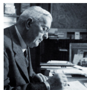
Gunning in 1953 aan tafel