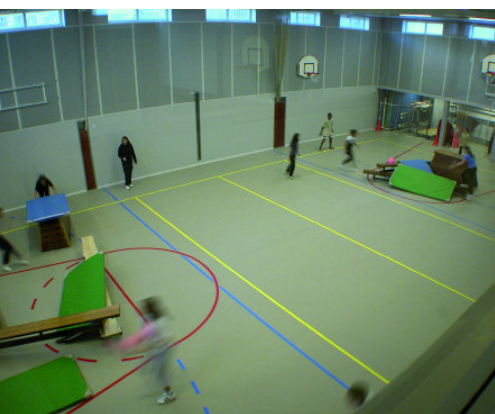
< Ondergrondse gymzaal > met daktuin