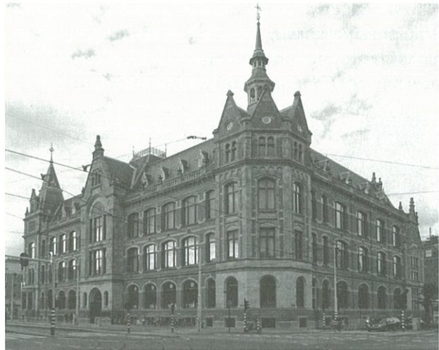
Voormalig Rijkspostspaarbankgebouw, thans Conservatorium Hotel, Amsterdam, D. Knuttel 1901, A. van Stigt 2012

Afgelopen december nam het Conservatorium Hotel een voorschot op de hopelijk terugkerende monumentaliteit en levendigheid van het museumkwartier die door de jarenlange verbouwingen van het Stedelijk- het Rijks- en het Van Gogh Museum weinig zichtbaar is geweest. Dit luxueuze 5 sterrenhotel is gevestigd in het door de toenmalige rijksbouwmeester D.E.C. Knuttel gebouwde directiegebouw voor de Rijkspostspaarbank uit 1901. Dit rijk gedecoreerde en solide gebouw heeft na het opgaan van de Rijkspostspaarbank in de geprivatiseerde Postbank van 1985 tot 2008 als onderkomen gediend van het Sweelinck Conservatorium.