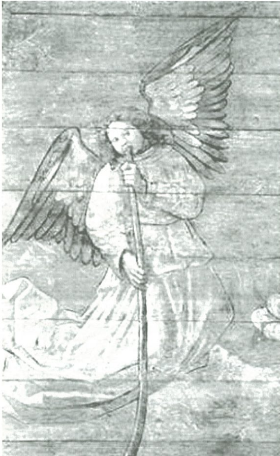
Detail gewelfschildering Grote Kerk Alkmaar, Jacob Cornelisz. van Oostanen

Het Laatste Oordeel is aangebracht in de koorsluiting boven het hoogkoor van de Grote Sint-Laurenskerk. Het beslaat een oppervlakte van 100 m 2 . Ondanks dit indrukwekkende formaat waren de details vanaf de begane grond beperkt zichtbaar. De kleuren zijn in 500 jaar wat vervaagd, en diverse lagen vernis gaven het kunstwerk een onnatuurlijke glans die evenmin bijdroeg aan een goede zichtbaarheid. Deze vernis is nu verwijderd. De gewelfschilderingen in het noordtransept zijn weer op hun oorspronkelijke plaats te zien. Dit deel van de schildering dat uit veertien vakken bestaat, was lange tijd onvindbaar, maar werd in