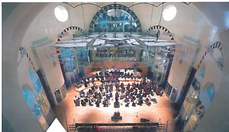
De Majellakerk huisvest sinds 2012 het Nederlands Philharmonisch Orkest en het Nederlands Kamer Orkest. Het is de tweede renovatie. Ook de eerste (in 1992) werd uitgevoerd door Architectenbureau J. van Stigt.

Van de Vondelkerk van toen naar De Hallen van nu is een sprong van ruim vijftientig jaar. Waarin drie kerken, een pakhuis en een toren een nieuw leven kregen.