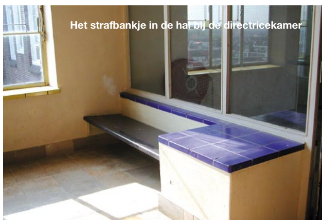
Het strafbankje in de hal bij de directricekamer