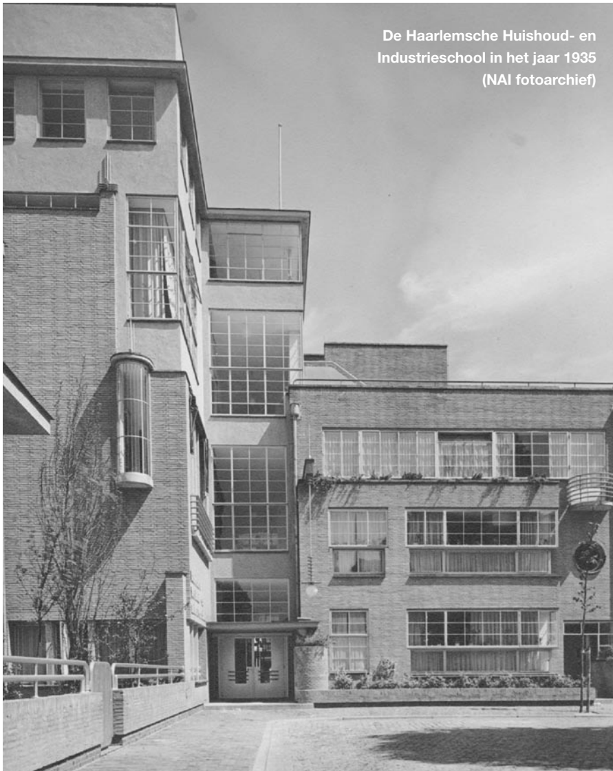
De Haarlemsche Huishoud- en Industrieschool in het jaar 1935 (NAI fotoarchief)

Voor de uitbreiding die Greiner realiseerde gold het tegendeel. De betonconstructie waarop de nieuwbouw is gebaseerd benutte hij door grote raamvlakken van staal en glas te realiseren. Ramen in de binnenmuren zorgden ervoor dat het daglicht tot diep in het gebouw kon doordringen. De gevelbekleding van terrazzo (uitgewassen granito met ruwe steentjes, in de bouwwereld tegenwoordig 'granitine' genoemd) die hij liet aanbrengen benadrukte het zeker voor die tijd moderne karakter van het gebouw.