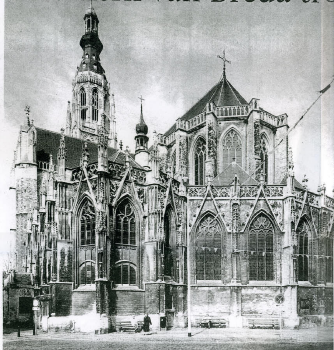
De Grote of O.L.-Vrouwekerk, begin jaren '90. Breda's grootste kunstschat oogde vervuld en verveerd en bleek door vocht zwaar aangetast. De natuurstenen balustrades waren bijvoorbeeld zo poreus geworden, dat ze met gas en ijzerdraad bij elkaar gehouden moesten worden.