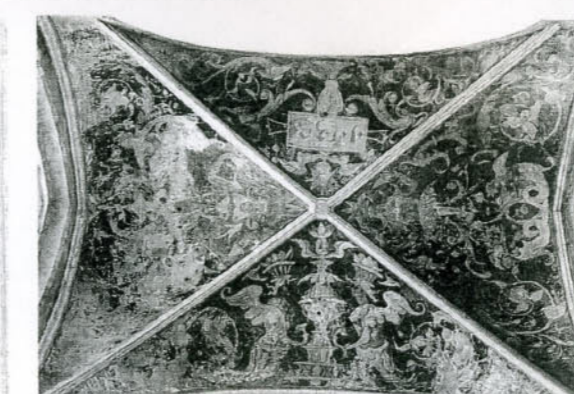
Het gewelf van de Prinsenkapel herinnerde anno 1991 in niets aan de glorieuze Renaissancekunst waarmee de Nassau hun grafkapel decoreerden.