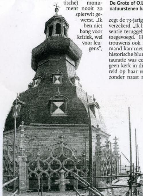
Herstelwerkzaamheden van de natuurstenen ornamenten aan de voet van de torenspits, in 1995.