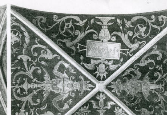
De gerestoreerde gewelfschilderingen ('arabesken') in de Prinsenkapel in 2004. Ook de Nassaukleuren blauw en goud zijn prominent teruggebracht.