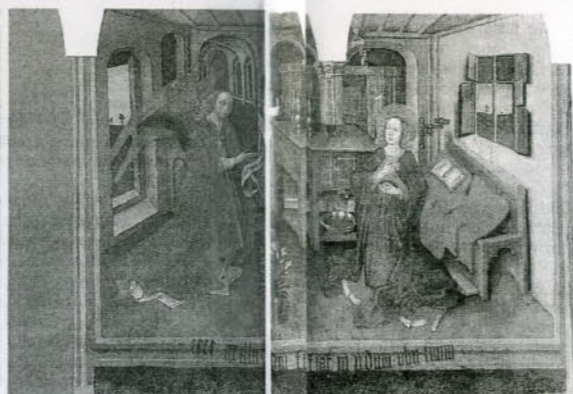
Met vernuftige technieken is de schildering met stuclaag en al van de muur afgehaald en in een atelier minutieus gerepareerd.