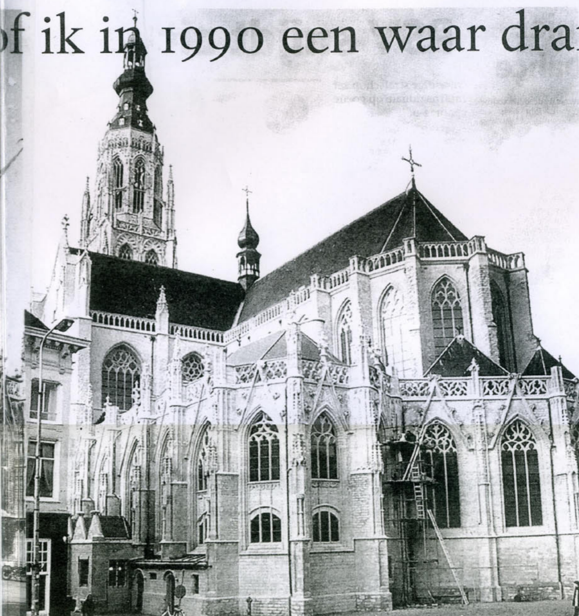
1997: de Grote Kerk in haar herstelde glorie. Breda's 'Witte Dame' is terug van weggeweest.

het standaardwerk van Ger van Wezel over de Grote Kerk. Hij noemt ze 'die jongens van de kunsthistorie, naar wie je niet moet luisteren, want die hebben een beperkte blik. Geen verstand van techniek. „Tijdens de restauratie is er niet een die mij heeft aangesproken. Ik ken alleen hun rug.” Een voorbeeld van hun leugens? In hun boek staat dat ik grafzerken heb doorgezaagd. 't Is gewoon niet waar.” De mensen van de rijksdienst met wie hij wel daadwerkelijk heeft