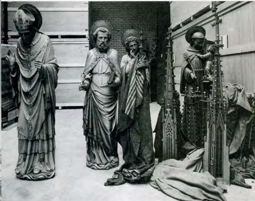
De beelden van de Vondelkerk

In 1980 verschenen, onder meer in Het Parool, alarmerende berichten over de toestand van de kerk, nota bene een beschermd rijksmonument. De beelden waren zonder vergunning krachtens de Monumentenwet verwijderd (en elders opgeslagen, in afwachting van verkoop), de kerkbanken waren, met de ondergelegen planken vloeren, als 'brandhout' verkocht. Zodoende was het zand dat zich bevond tussen de bolle kanten van de keldergewelven en de vloeren aan de oppervlakte gekomen en daarin lagen nog twee verwrongen orgelpijpen, als enige restant van het fraaie Adema-orgel. Van de preekstoel was slechts de helft over, uit de gebrandschilderde ramen verdwenen steeds meer fragmenten, bijvoorbeeld vierpasmotieven die door 'handelaren' met kennelijk overleg waren weggeknipt; massa's duiven zorgden voor een onbeschrijflijke smeerbeel. Die situatie veranderde in 1981 in zoverre dat de kerk werd betrokken door zes krakers; de entree bedroeg