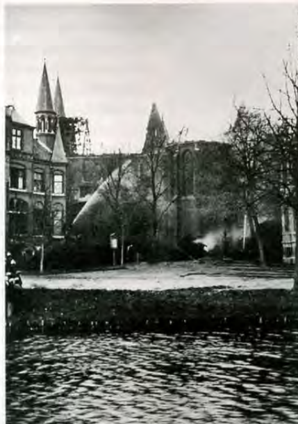
De brand van 1904

In 1904 overleefde de Vondelkerk op het nippertje een ver-